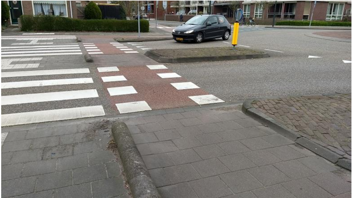
Figuur 8 (onzichtbare) varkensruggen.