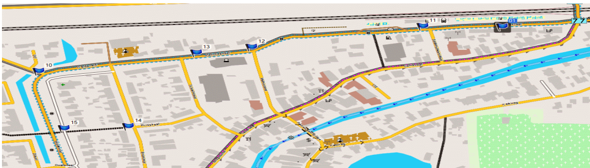
Figuur 4 knelpunten Schapedrift Ekster

De doorgaand fietsroute vanaf het westelijke (snel)fietspad gaat over de Schapedrift v.v. Dat is onveilig bij het oversteken van de kruising. Geadviseerd wordt de Schapedrift uit het netwerk te halen en fietsers over de (als fietsstraat in te richten) Ekster naar de hoofd fietsroute te leiden.