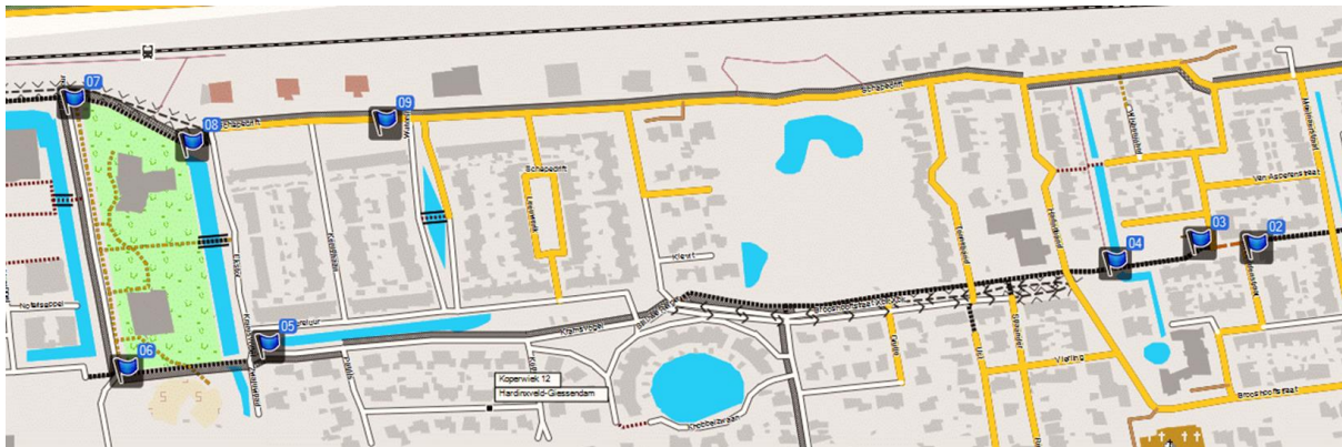
Figuur 2 overzicht paaltjes