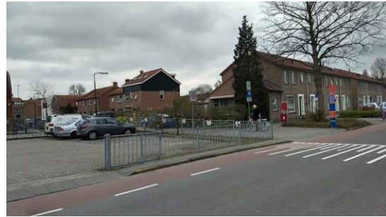
Figuur 6 Schoolstraat, oprit naar hoofdfietsroute realiseren