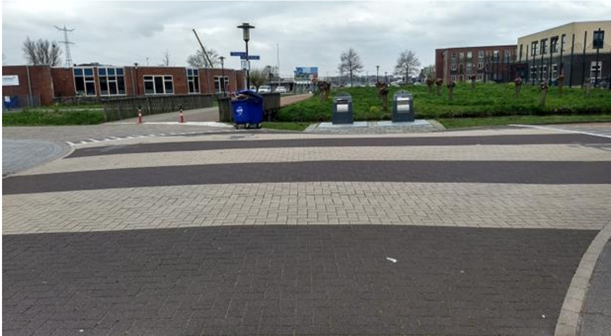
Figuur 3 Shared space met onduidelijke richtingen