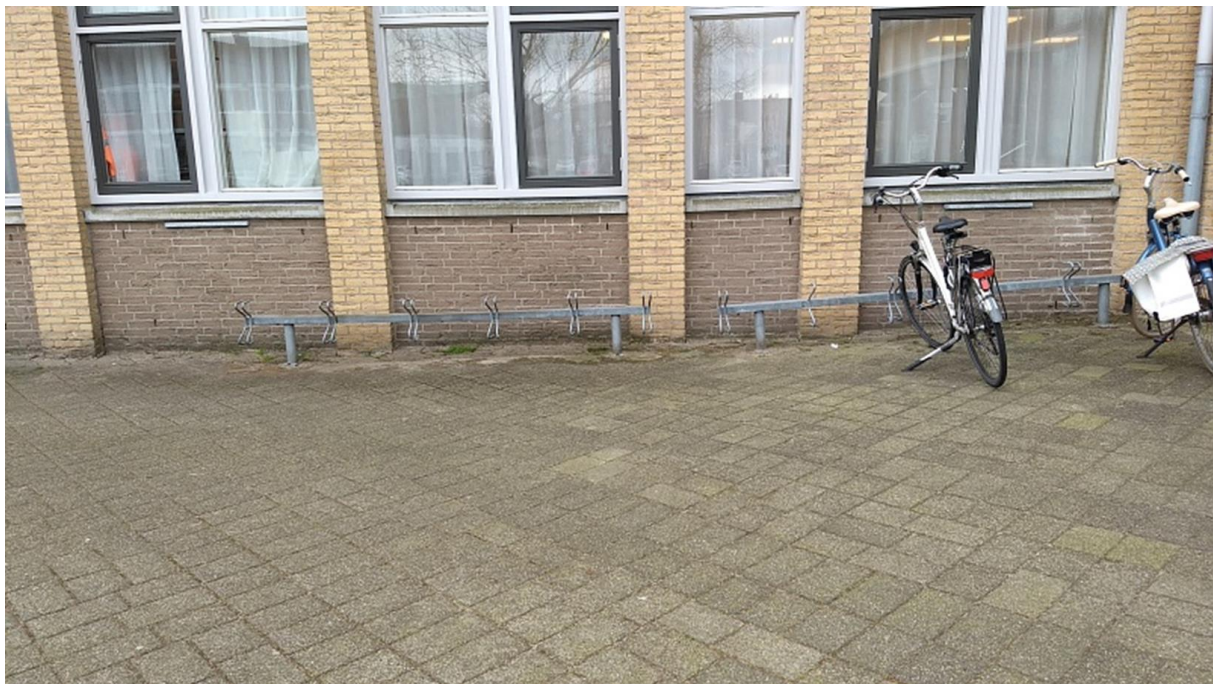
Figuur 9 stalling voor gemeentehuis

De voorzieningen voor het gemeentehuis voor het stallen van de fiets voldoen op geen enkele manier aan de daarvoor gestelde richtlijnen. Over de toepassing van die richtlijnen is door de Fietsersbond in 2012 onderzoek gedaan in Dordrecht. Dit lijkt ook goed toepasbaar te zijn voor Hardinxveld-Giessendam ( zie rapport ).