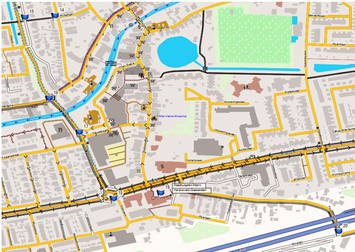
Figuur 7 locaties knelpunten