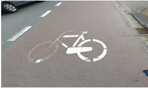
Figuur 5 afgesloten symbool

Er zijn geen borden naar het centrum. De meest logische fietsroute gaat via de Molenstraat, maar is niet aangegeven. Via het fietsknooppuntensysteem kan men wel in het centrum komen.