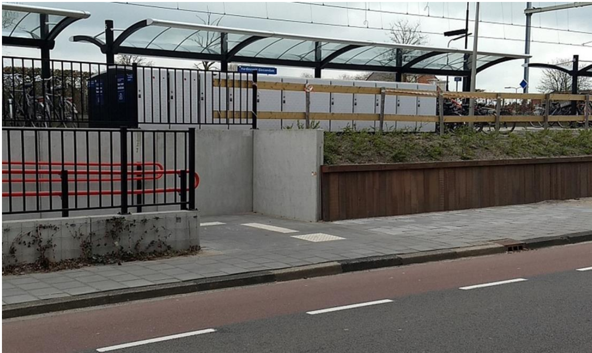
Figuur 10 Toegang station Hardinxveld- Giessendam, ontbrekende op- afgang.